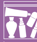
가로 세로 약 20cm 크기

물품을 휴대하고 검사 지점을 통과할 때, 다시 한 번 확인해야 할 사항: