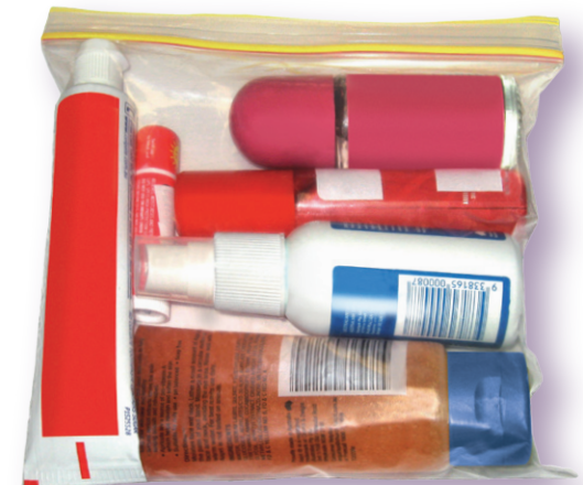
가로 세로 약 20cm 크기

국제선 이용에 따른 보안 검사 통과 시, 액체, 에어로솔, 젤 휴대에 관한 새로운 규정